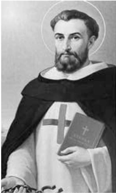
San Juan de Mata

Su infancia la pasó en la Provenza, dejándose modelar por la realidad cultural, social y religiosa de la época. Hubo una confluencia de sucesos –las cruzadas, aperturas de nuevos mercados, aparición de una nueva clase social de hombres de negocios, etc.,- que derivó en una profunda transformación de las ciudades y la vida social (ciudades más libres, menos barreras sociales, etc.)